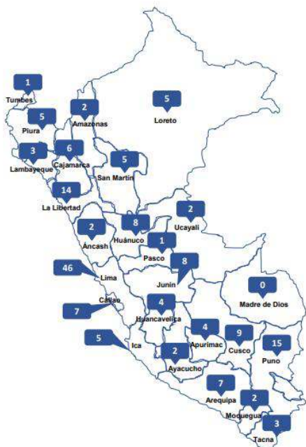
Figura N° 2 Casos de feminicidio a nivel nacional

Los departamentos con mayor número de casos de víctimas con características de feminicidio son: Lima 46 casos, Puno 15 casos, La Libertad 14 casos, Cusco 9 casos, Junín 8 casos, Huánuco 8 casos, Arequipa 7 casos, Callao 7 casos, Cajamarca 6 casos, Piura 5 casos, Ica 5 casos, San Martín 5 casos, Loreto 5 casos, Huancavelica 4 casos, Apurimac 4 casos