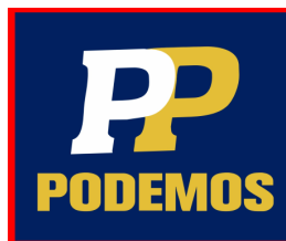
Podemos por el Progreso del Perú

25. Ahora bien, en el caso en concreto y siguiendo lo expuesto en el considerando anterior, se advierte que nos encontramos ante tres (3) organizaciones políticas (una de ellas cancelada), que presentan los siguientes símbolos: