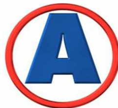
Alianza para el Progreso